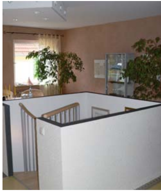
Neue Treppe als Verbindung zum Erdgeschoss

schäft. „Meine Frau hat schon vor der Eröffnung des neuen Fachgeschäfts mit Selbermachen gearbeitet. Ihre Workshops „Kreative Wandgestaltung“ waren immer ausgebucht. Uns ging es dabei darum, anspruchsvollen Kunden, die nicht alles vom Handwerker machen lassen wollen oder können, Freude an Qualität und kreativem Schaffen zu vermitteln.“, erklärt