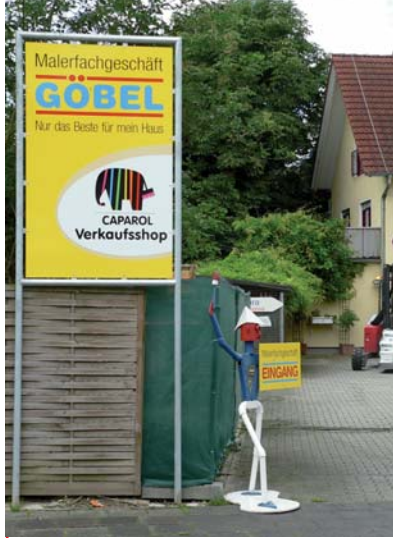
Einladende Außenwerbung fürs Fachgeschäft