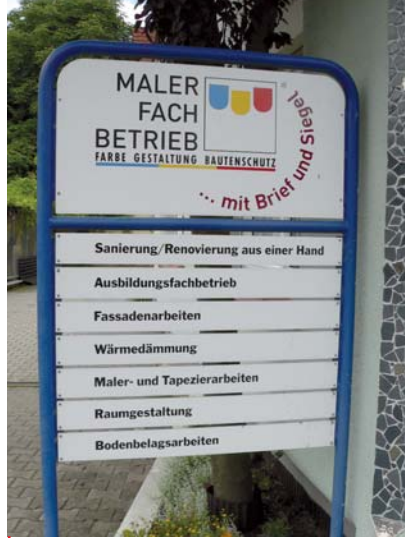
Außenwerbung für den Malerfachbetrieb mit Brief und Siegel