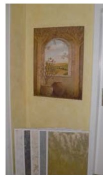
Der bisherige Beratungsbereich im Obergeschoss