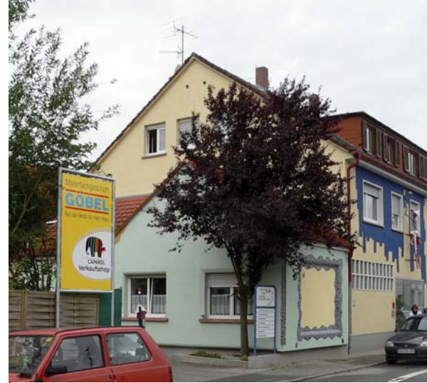
Die Straßenfront Ueberauer Straße in Reinheim