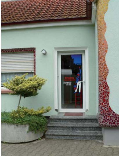
Eingang ins neue Fachgeschäft