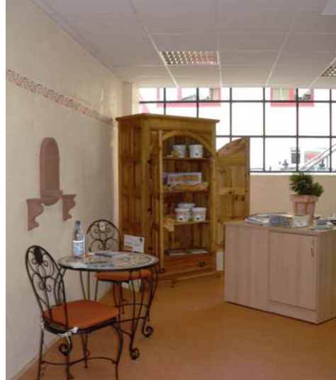
Das erweiterte Beratungsstudio im Erdgeschoss