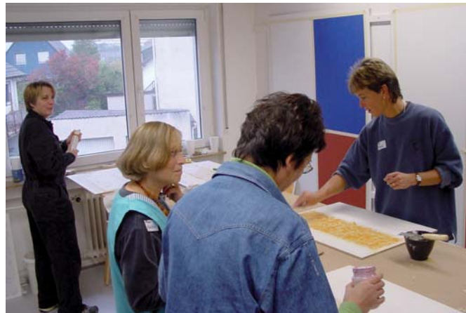
Workshops „Kreative Wandgestaltung“

Beste Zukunftsperspektiven Absolute Kundenorientierung, fachliche und menschliche Qualifikation, aktives Marketing und das feine Gespür für Bedürfnisse und gewachsene oder veränderte Ansprüche von Kunden und Interessenten sind die besten und wichtigsten Voraussetzungen für eine gedeihliche Wei-