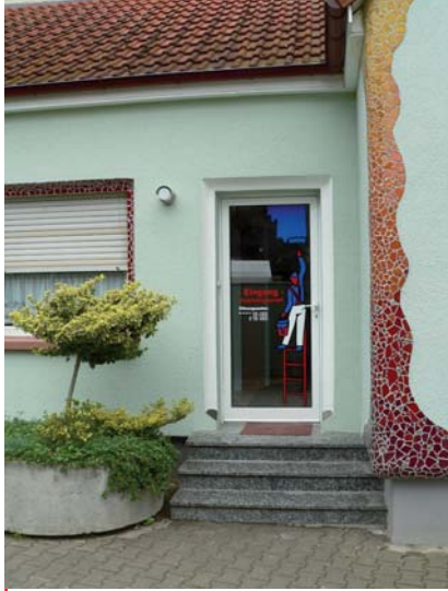
Eingang ins neue Fachgeschäft